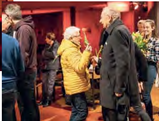
(Bild rechts) Gegenseitiges Verabschieden und Vorfreude aufs nächste Mal

zu bleiben. Und wer mochte, der konnte sich eine Tulpe mitnehmen – um diese an einen lieben Menschen weiterzuschicken.