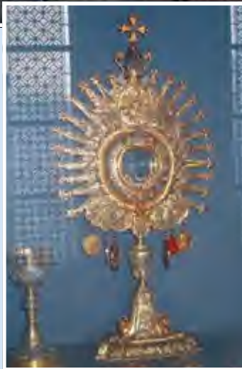
Basilika St. Lambertus