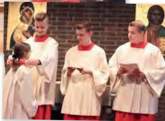
Die Überreichung von Messdienerplakette und Urkunde

Am 1. Advent wurden dreizehn Mädchen und Jungen in einem feierlichen Gottesdienst in St. Johannes in die Messdiener-Gemeinschaft aufgenommen. Dazu gratulieren wir ihnen herzlich und bedanken uns für ihre Bereitschaft, die heiligen Messen für uns würdig mitzugestalten. Wir wünschen ihnen viel Freude bei diesem Dienst und viele schöne Stunden im Kreis der Ministranten-Schar.