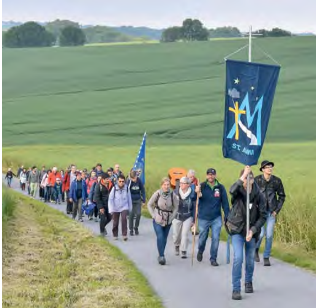
Nachtwallfahrt 2019 – Auf dem Angerweg