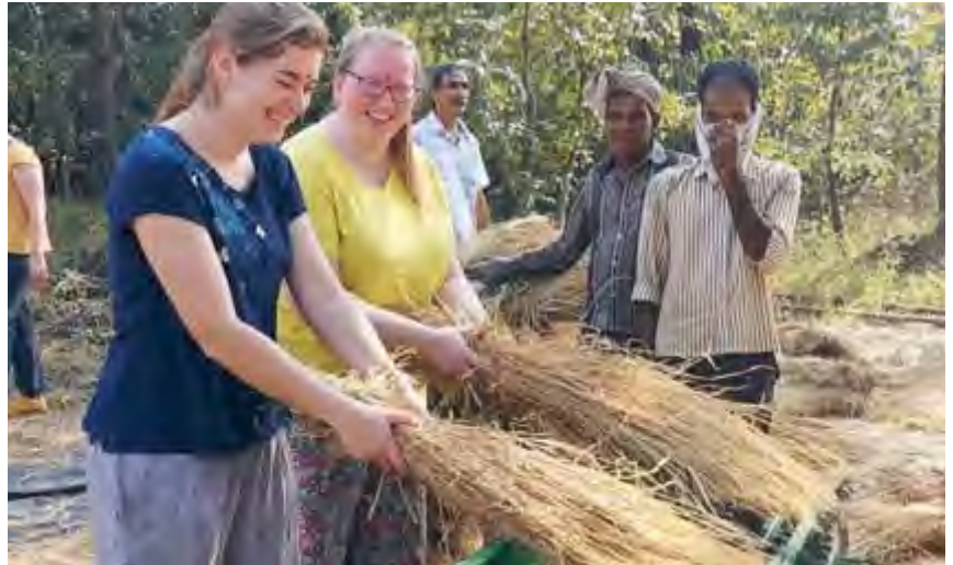
Bei der Reisernte

Mit all diesen verschiedenen Eindrücken endete nach 10 Tage unsere Reise nach Indien. Während unserer beeindruckenden Zeit in Indien sind tolle Freundschaften zwischen uns, den Indern, aber auch unseren beiden deutschen Chören entstanden. Eine weitere gemeinsame Reise mit dem Chor