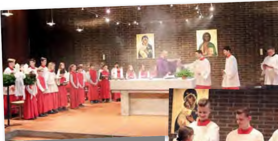
Der Einführungsgottesdienst vor Aufnahme der einzelnen Messdienerinnen und Messdiener

Am 1. Advent wurden dreizehn Mädchen und Jungen in einem feierlichen Gottesdienst in St. Johannes in die Messdiener-Gemeinschaft aufgenommen. Dazu gratulieren wir ihnen herzlich und bedanken uns für ihre Bereitschaft, die heiligen Messen für uns würdig mitzugestalten. Wir wünschen ihnen viel Freude bei diesem Dienst und viele schöne Stunden im Kreis der Ministranten-Schar.