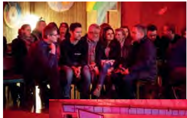
(oben) Gemeinsames Bibelteilen

Nach dem Vorlesen des Bibeltextes vom verlorenen Sohn ging es dann zunächst darum, sich in Kleingruppen gemeinsam darüber auszutauschen: „Was hat mich berührt, bewegt oder angesprochen“?