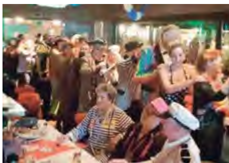
Hochstimmung im Pfarrsaal