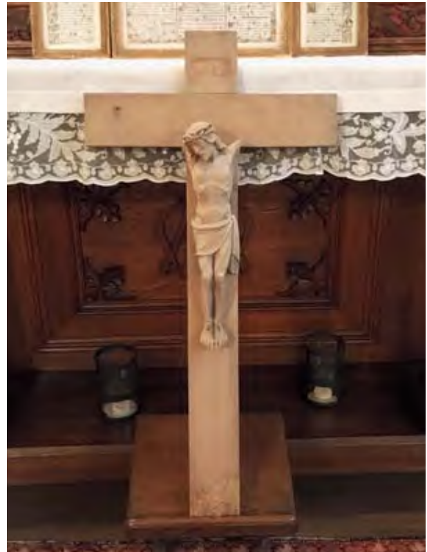
Das gereinigte Kruzifix in der Schlosskapelle Linnep

Sehr wahrscheinlich ist der Jesus ohne Arme von Irgendjemandem in unserm Waldstück an der Bundesstraße entsorgt worden. Jemand, der keine Achtung oder Respekt vor meinem Gott hat? Oder wollte Jesus es so? Immerhin ist er von mir gefunden worden und schafft es nun auf die Titelseite einer bedeutenden deutschen Kirchenzeitung!