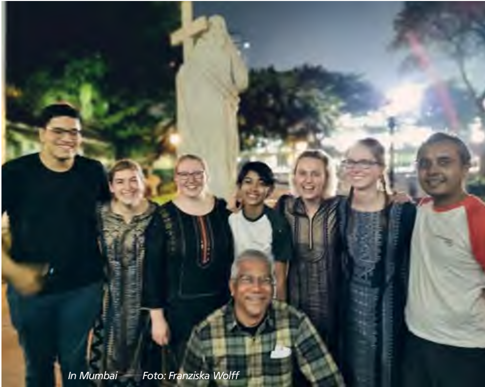
In Mumbai

dien zuständig sind und uns die indische Kultur lebhaft näherbringen würden. Wir merkten gleich, dass die drei mit uns auf einer Wellenlänge waren, wir den gleichen Humor haben, sehr hilfsbereit sind und wir uns bei ihnen gut aufgehoben fühlten. Zum Restaurant fuhren wir zum ersten Mal mit Rickshaws. Wir waren total aus dem Häuschen und doch hatten wir Respekt vor der Fahrt und waren froh, als wir unbeschadet am Restaurant ankamen. Den Rückweg nach Hause sind wir dann gelaufen, 30 Minuten quer durch Mumbais Stadtteil Bandra, am Meer entlang oder durch gut belebte Straßen. Denn am Abend ist jeder auf den Straßen, sogar kleine Kinder. Zurück in unseren Wohnungen dachten wir, den Tag kann nichts mehr toppen, aber es folgten neun weitere einzigartige Tage, an denen wir immer wieder von all den Menschen und Eindrücken überwältigt waren.