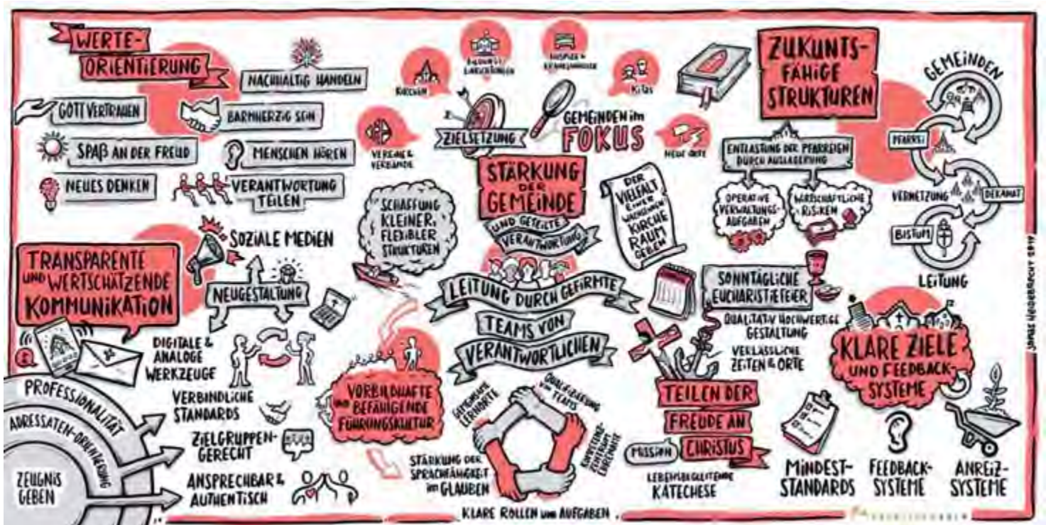
Grafik zur aktuellen „Zielskizze zum pastoralen Zukunftsweg“

Seinen Ansatzpunkt hat dieser Weg beim Glauben und den Begabungen aller in der Kirche: Im gemeinsamen Lesen der Heiligen Schriften, dem Bibelteilen, sollen Impulse für das pastorale Handeln gefunden werden. Jeder Christ ist aufgrund von Taufe und Firmung berufen, das Heilige in seinem eigenen Leben zu entfalten und eben dadurch Welt und Kirche im Geiste Jesu Christi mitzugestalten.