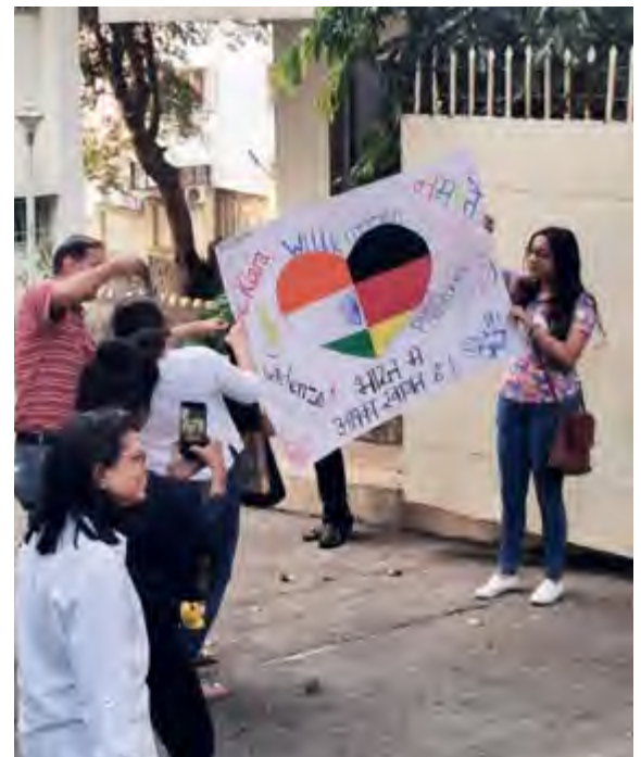
Ein herzlicher Empfang

Auf einmal hielt der Bus und es hieß aussteigen, mit einem schnellen Blick aus dem Fenster konnten wir kaum glauben, was wir sahen. Dort standen viele Menschen – Sänger und Sängerinnen aus dem indischen Chor, die Chorleiterfamilie Cordo, die diese Reise möglich gemacht hat und viele Eltern – mit einem liebevoll gebastelten Plakat und noch viel herzlicheren Blumenketten nach indischer Tradition, die nur für uns gemacht wurden. Natürlich flossen hier die ersten Tränen, vielleicht vor Freude, Erleichterung und wahrscheinlich auch vor Dankbarkeit, dass wir in so ein tolles Abenteuer so liebevoll starten können. Wir wurden mit ebenso warmen und herzlichen Worten empfangen und