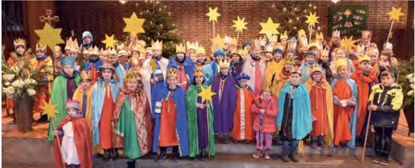
Aussendung der Sternsinger in Lintorf