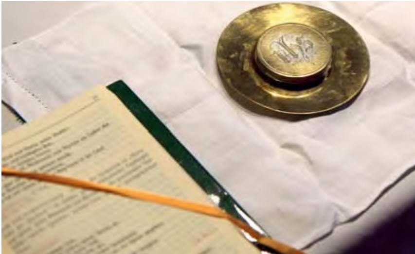
Pyxis und Messbuch für die Krankenkommunion

„Wie ich mich freue, dass sie kommen! Aber nicht in erster Linie wegen Ihnen, sondern wegen dem, den sie mitbringen!“ So begrüßte mich vor einigen Wochen etwas schmunzelnd eine ältere Frau, der ich ungefähr monatlich die Kommunion nach Hause bringe.