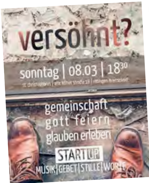
Der Flyer des dritten StartUp Gottesdienstes / Max Moll

8. März 2020 in St. Christophorus in Breitscheid