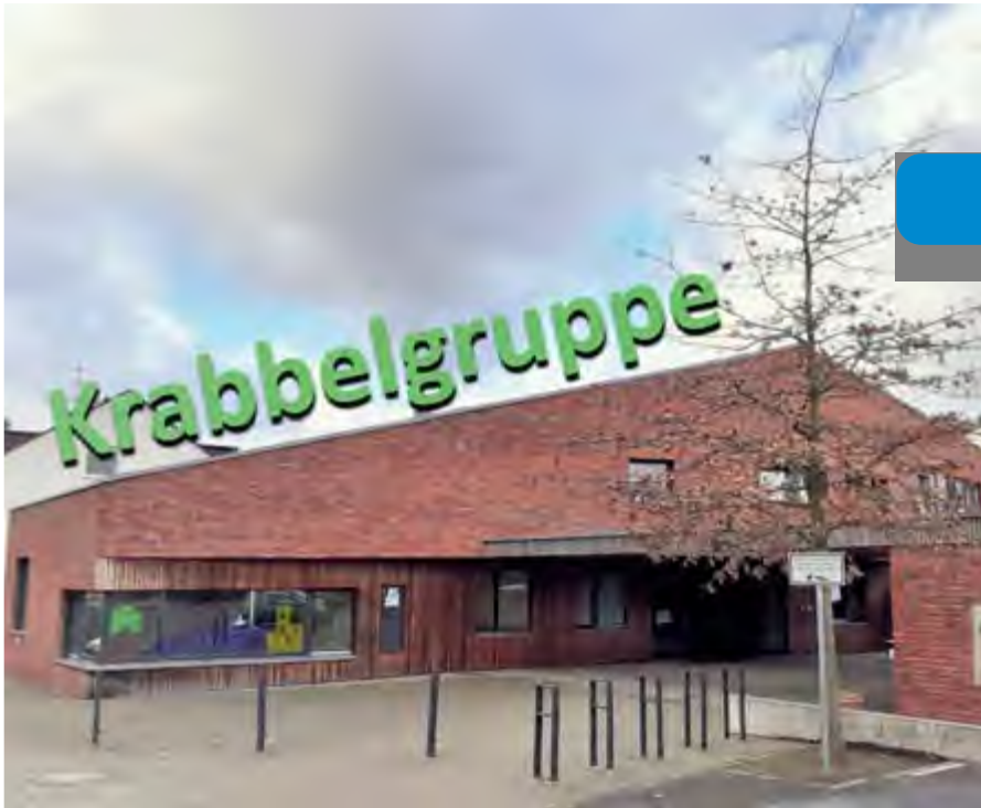
Das Pfarrzentrum Hösel

In diesem Jahr startet die Pfarrei St. Anna ein neues Projekt für unsere jüngsten Pfarrmitglieder und ihre Eltern. Ab dem 3. März 2020 gibt es in den Räumen des Pfarrzentrums St. Bartholomäus in Hösel einmal im Monat eine Krabbelgruppe für Kinder von 0–2 Jahren.