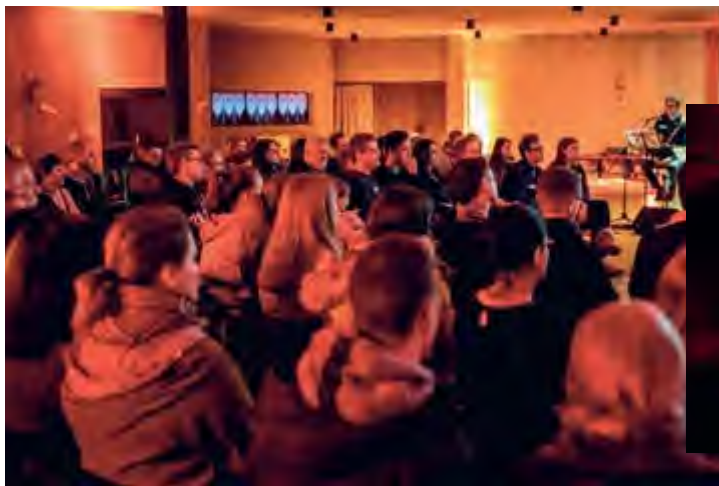
StartUp Gemeinschaft im umgestalteten Kirchenraum