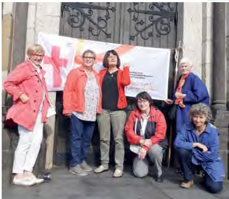
Donnerstagsgebet vor der Pfarrkirche Peter und Paul