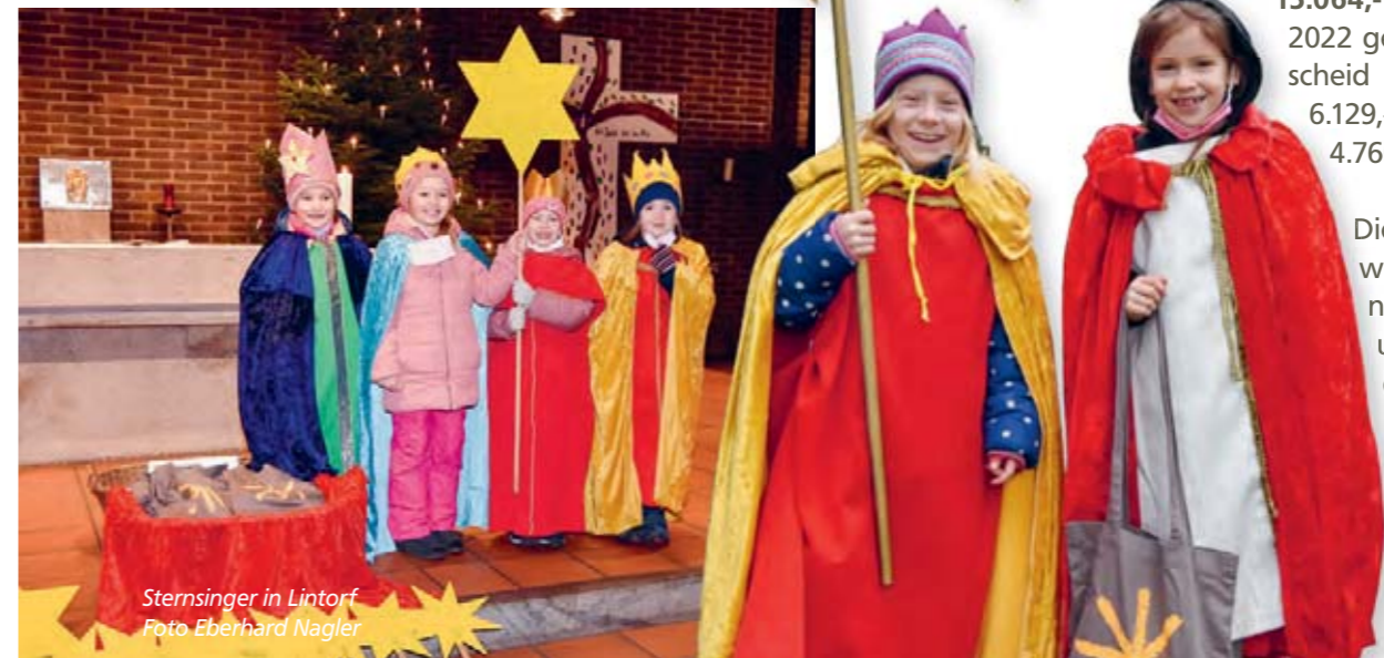
Sternsinger in Lintorf