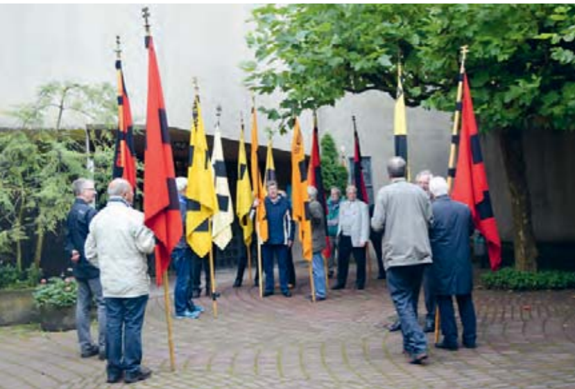
Diözesanwallfahrt der KAB, Mariendom Neviges