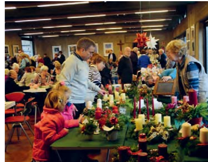
Adventsbasar in St. Johannes.