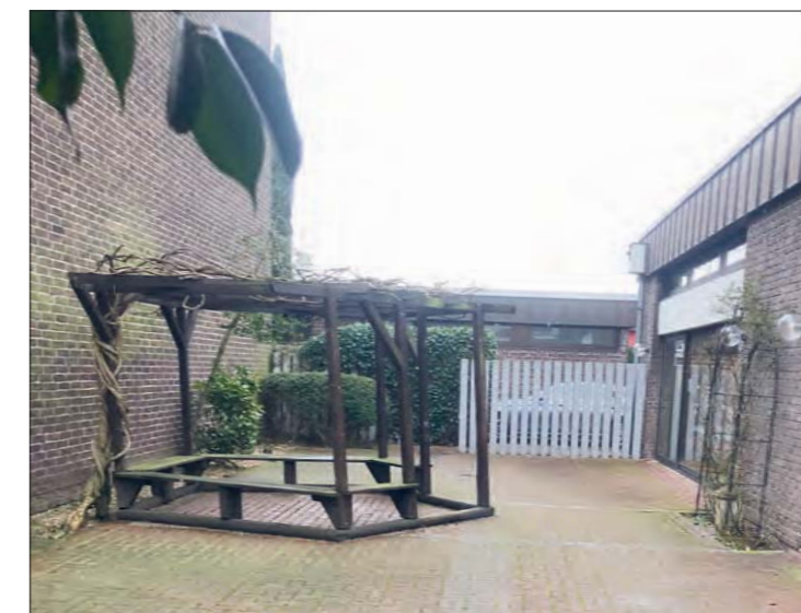
Der Innenhof von St. Johannes