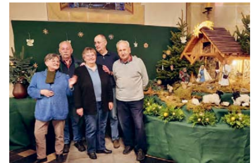
KAB-Mitglieder vor „ihrer“ Krippe

Für die Kolpingfamilie Lintorf, Cecilia Winkler