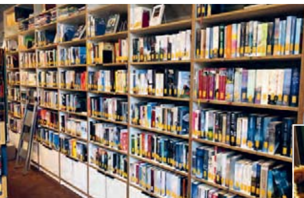
Die Auswahl ist groß