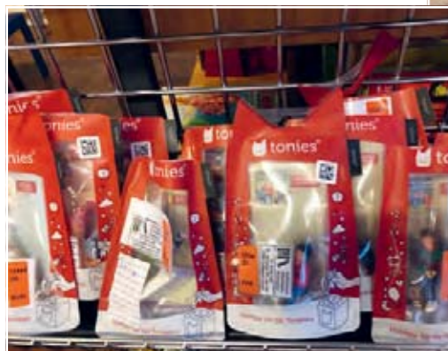
Kinderangebot up to date