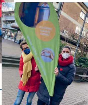
Auf dem Lintorfer Marktplatz