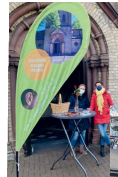
Einladung vor der Kirche St. Anna

Am 12. Februar stand das Team von „Offene Kirche – offenes Ohr“ wieder zur Marktzeit am Vormittag vor der St. Anna Kirche in Lintorf und kam mit vielen Menschen ins Gespräch. Zum Valentinstag wurden kleine Geschenke verteilt und es wurde in die offene Kirche eingeladen. Dieses Angebot nahmen Einige auch gerne an und zündeten Kerzen für Ihre Lieben an. Zum Schluss erhielt das Team noch Röschen vom Blumenhändler auf dem Markt.