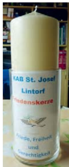
KAB Friedenskerze

Die erzielten Gewinne aus allen Adventsbasaren, und das waren teilweise Beträge über 2000 Euro pro Basar, gingen zu 100 % an karitative Einrichtungen.