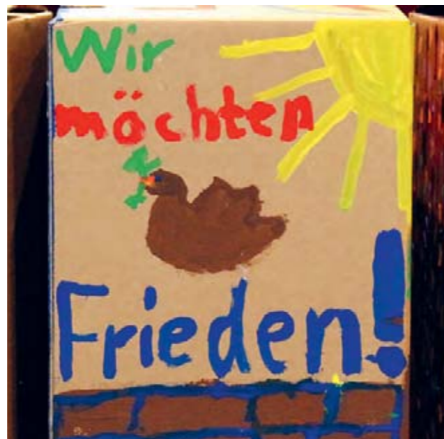
Wir möchten Frieden.

Ich bin in Gedanken bei all den Menschen, die in diesen Tagen an der Front kämpfen. Bei all den Menschen, die verwundet werden. Die ihr Leben verlieren. Die Kriegs-traumata erleiden. Die fliehen müssen. Ich denke an Familien, die getrennt werden. An Eltern, die um ihre Kinder bangen. An Paare, die sich um ihre Partner sorgen. An Angehörige, die um Getötete weinen.