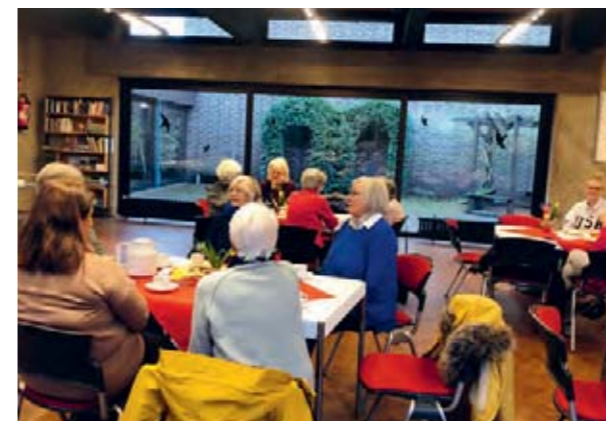
Mittwoch-Nachmittag im Pfarrzentrum St. Johannes.

leckeren Kaffee. Natürlich gibt es für die kleinen Besucher auch etwas zu trinken und zu knabbern. Zwischendurch kommen und gehen die Büchereibesucher, manche haben heute keine Zeit – aber vielleicht beim nächsten Mal.