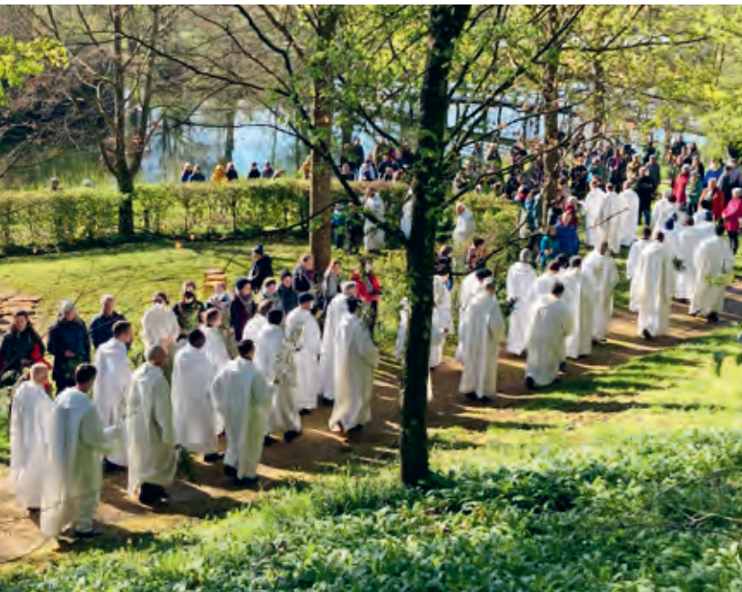
Palmsonntags- prozession im Garten der Stille

Am Palmsonntag gab es einen sehr schönen Gottesdienst, wo jeder einen Palmenzweig bekommen hat, welcher später auch gesegnet wurde. Die Messe startete im Garten der Stille und anschließend sind wir mit den Brüdern zusammen zur Kirche gelaufen.