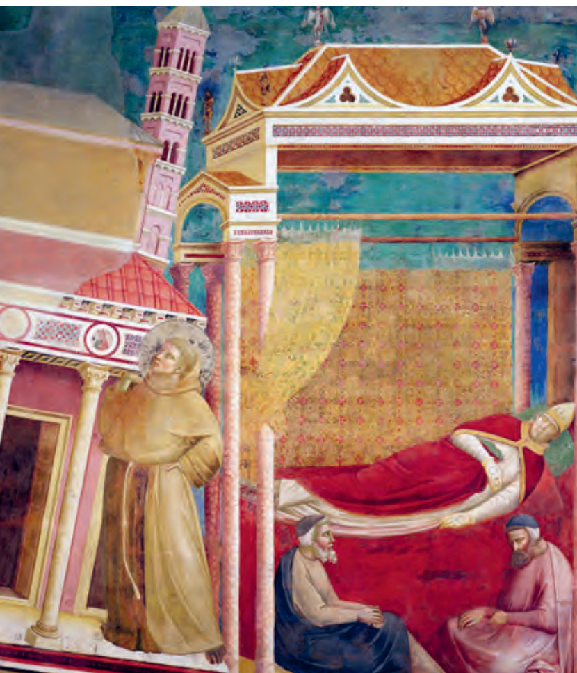
Foto: Der Traum von Innozenz III: Franziskus stützt die Kirche, während der Papst schläft. Fresko von Giotto di Bondone

Wenn ich in letzter Zeit mit Menschen über die Kirche ins Gespräch komme, kommt immer häufiger gerade in der Diözese Köln die Frage auf, ob es nicht besser wäre, aus dieser katholischen Kirche auszutreten. Ob in zufälligen Urlaubsgesprächen, ob in Gesprächen im Verwandtenkreis oder auch in der Gemeinde – diese Frage beschäftigt nicht wenige.