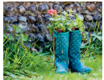
Katholische Kinderzeitschrift Regenbogen Nr. 02 – 2018/19, S. 19, in: Pfarrbriefservice.de. 2 Fotos in Pfarrbriefservice, Stiftebehälter: Ronja Goj