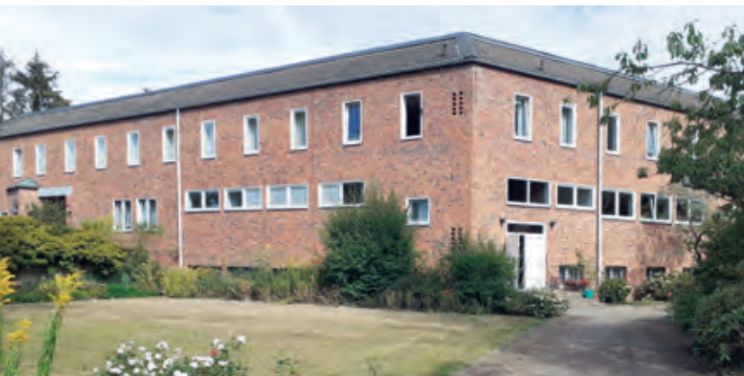
Das Kloster Sankt Katharina