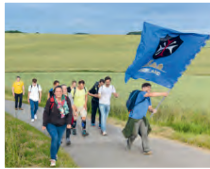
Der Anstieg zum Heiligenhauser Weg