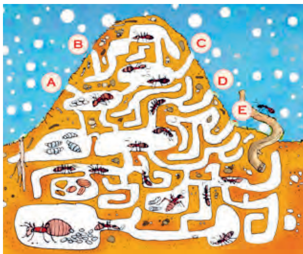
Auflösung: Seite 27

Auch die Ameisen begeben sich in der kalten Jahreszeit in ihr Winternest. Sehr weit müssen sie nicht krabbeln, dafür aber sehr tief. Das Winternest der Ameisen liegt oft bis zu einem Meter unter der Erde. Ein Meter ist für eine kleine Ameise so viel wie für uns etwa 40 Stockwerke. Dort unter der Erde ist es wärmer als in den oberirdischen Hügeln. Am tiefsten Punkt versammeln sich die Königin und die Arbeiterinnen und fallen dort in eine Art Winterstarre bis zum Frühling.