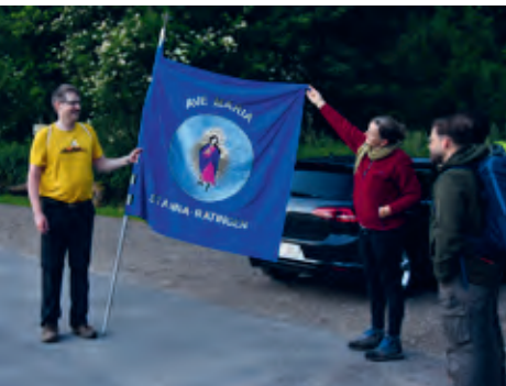
In der Morgendämmerung im Angertal