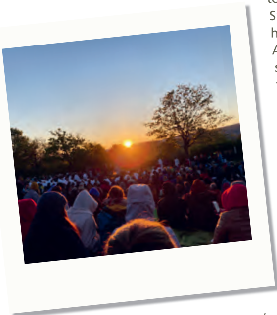
Sonnenaufgang zu den Lesungstexten der Osterliturgie

Da wir über Ostern in Taizé waren, gab es am Ostersonntag ein großes Osterfeuer, wo wir im Garten der Stille saßen und den Brüdern, welche die Lesungstexte in verschiedenen Sprachen vorgelesen haben, zuhörten. Die Atmosphäre war echt schön und es war als wäre man eine große Familie. Das Osterfeuer fand morgens um 6 Uhr statt, weshalb wir noch einen wunderschönen Sonnenaufgang sehen konnten, was den Morgen nur noch schöner gemacht hat.