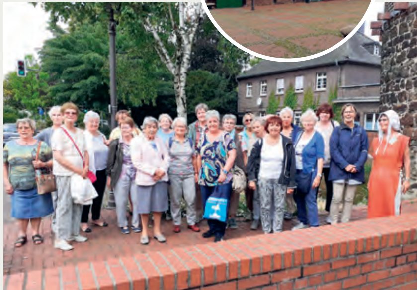
Die kfd-Gruppe