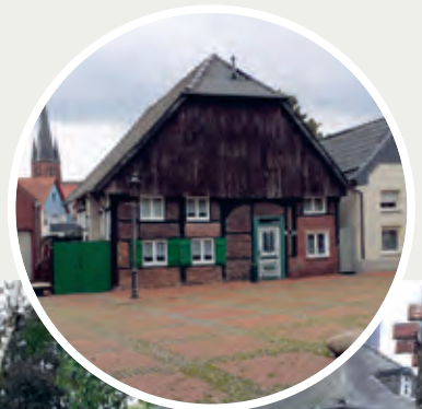
oben: Impression aus Haltern, Foto: privat

KURZNACHRICHTEN LINTORF +++ KURZNACHRICHTEN LINTORF +++ KURZNACHRICHTEN LINTORF +++ KURZNACHRICHTEN LINTORF