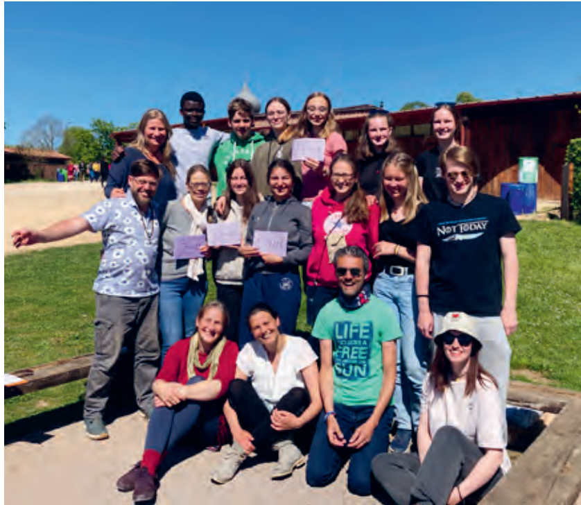
Unsere gesamte Ratinger Taizégruppe

Luisa Laux (Autorin) und Christoph Schmitz (Fotos)